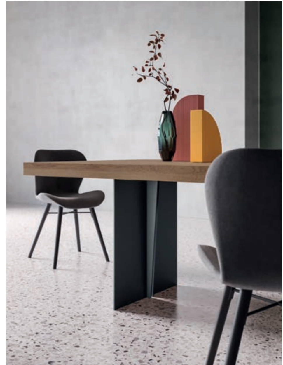
Piano/top. / M2 - Gambe/legs. / Stylo - Sedia/chair. / Gloves