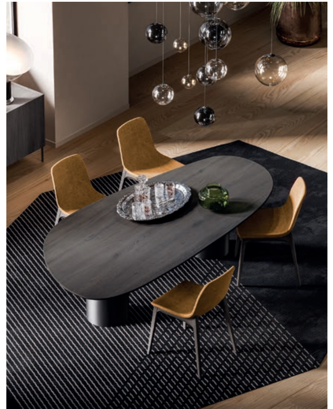
Piano / top Stone _ Gamba / legs Pillar

Creato per rompere gli schemi, questo tavolo trasforma ogni cena in un'esperienza chic e moderna. Con le sue linee sinuose e asimmetriche, il nuovo piano Stone abbraccia l'irregolarità con creatività e fascino.